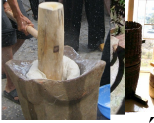
Cối xay lúa Cối giã gạo /quét bánh phồng Cối xay bột Phơi bánh tráng

giữa tháng chạp, bắt đầu lo xay lúa, xay nếp để chuẩn bị tráng bánh, bánh tráng thì