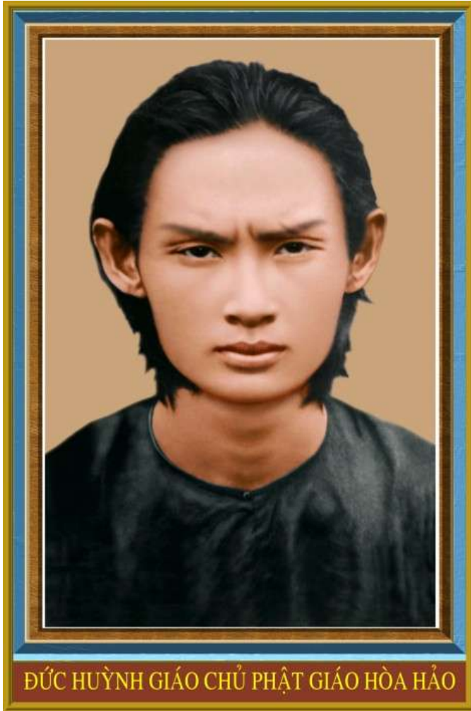
ĐỨC HUỲNH GIÁO CHỦ PHẬT GIÁO HÒA HẢO